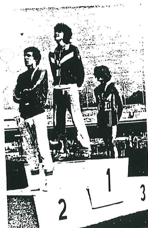
1.500 m remise des médailles - un moment de grande satisfaction