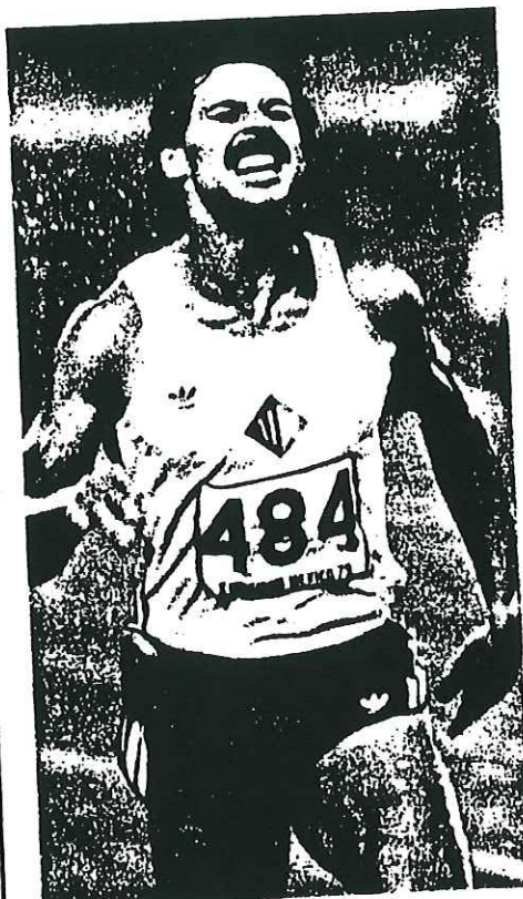
Harald SCHMID improving universiade record under a tropical rain.