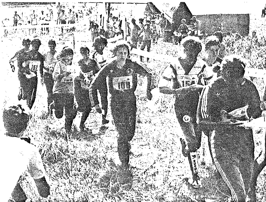
Starten har just gått i damernas stafett.